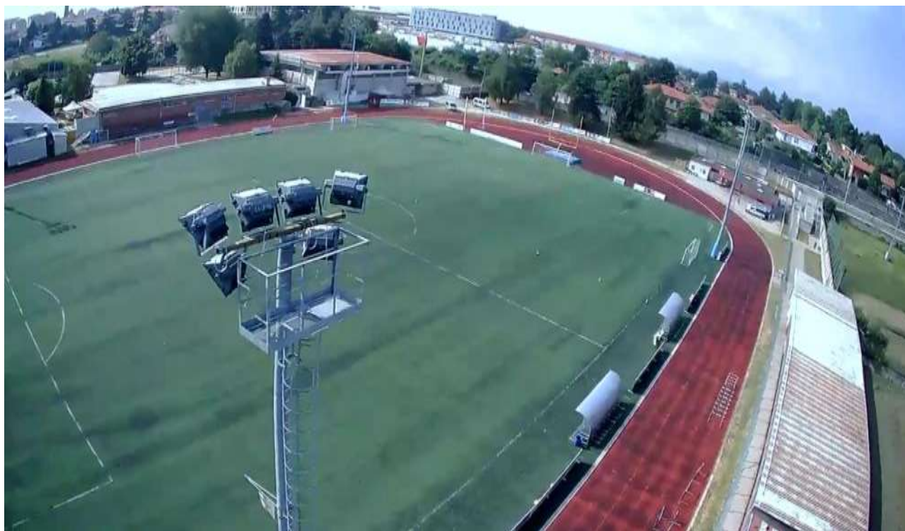
Punto di ripresa 5