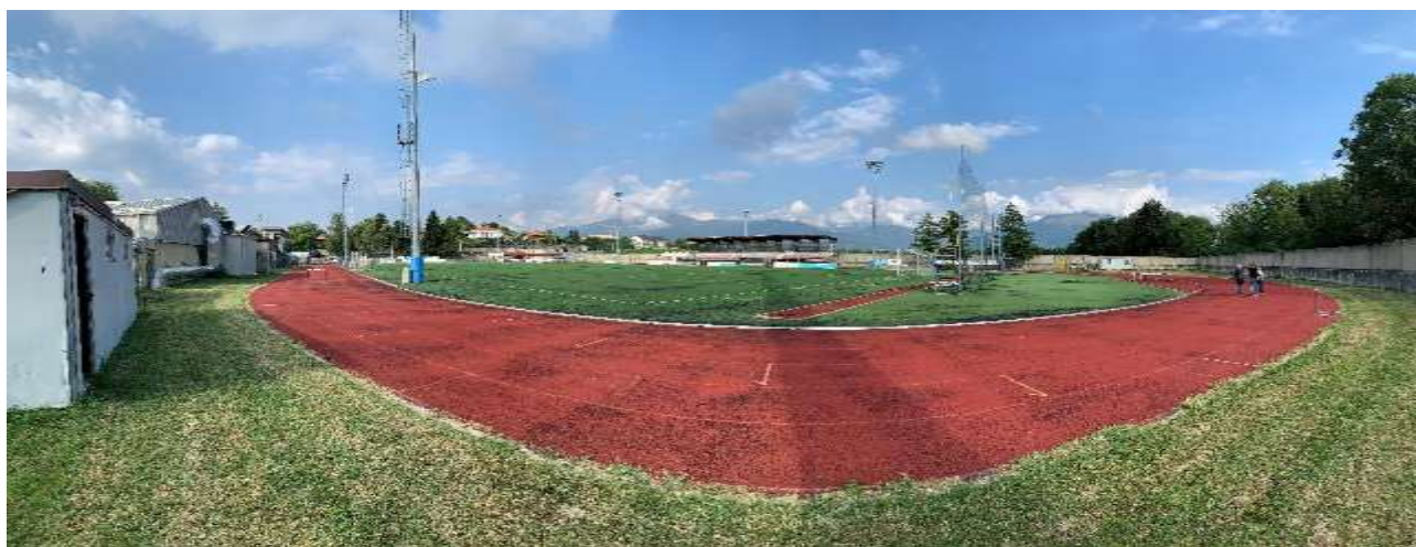
Punto di ripresa 6