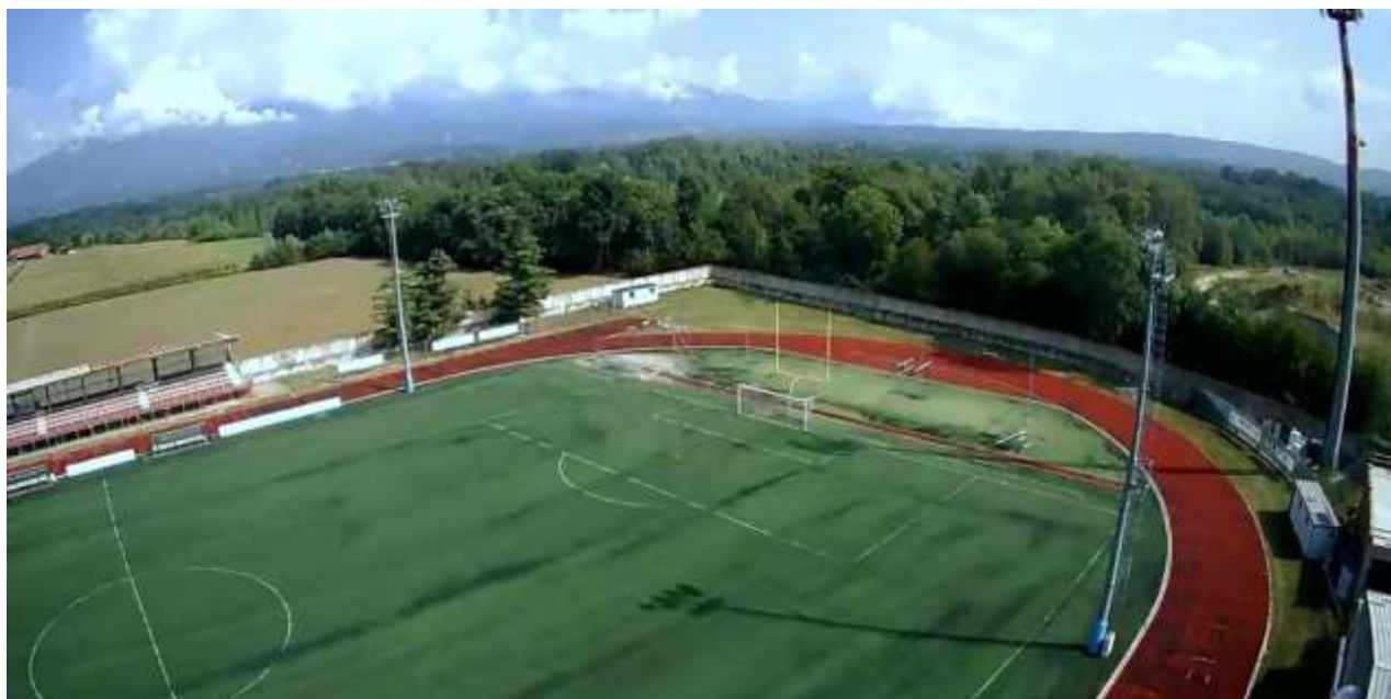
Punto di ripresa 3