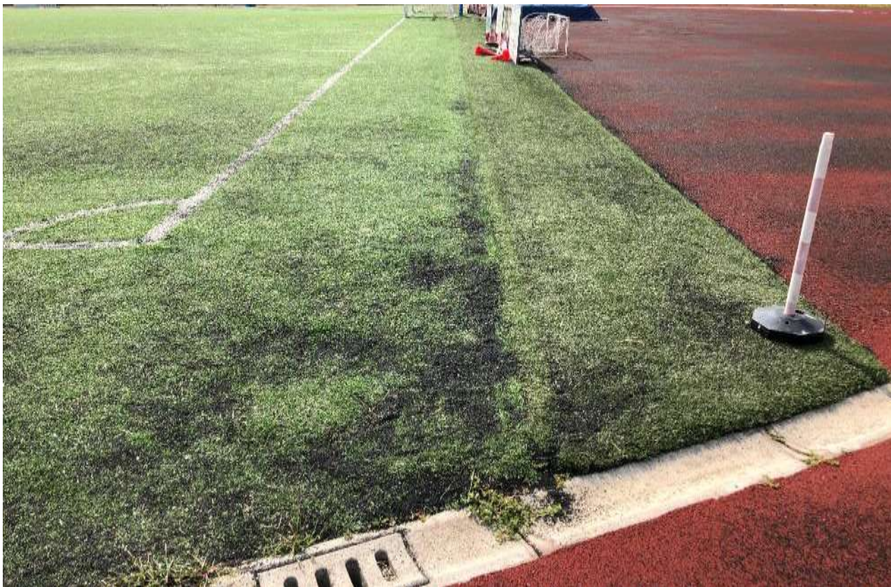
Punto di ripresa 13