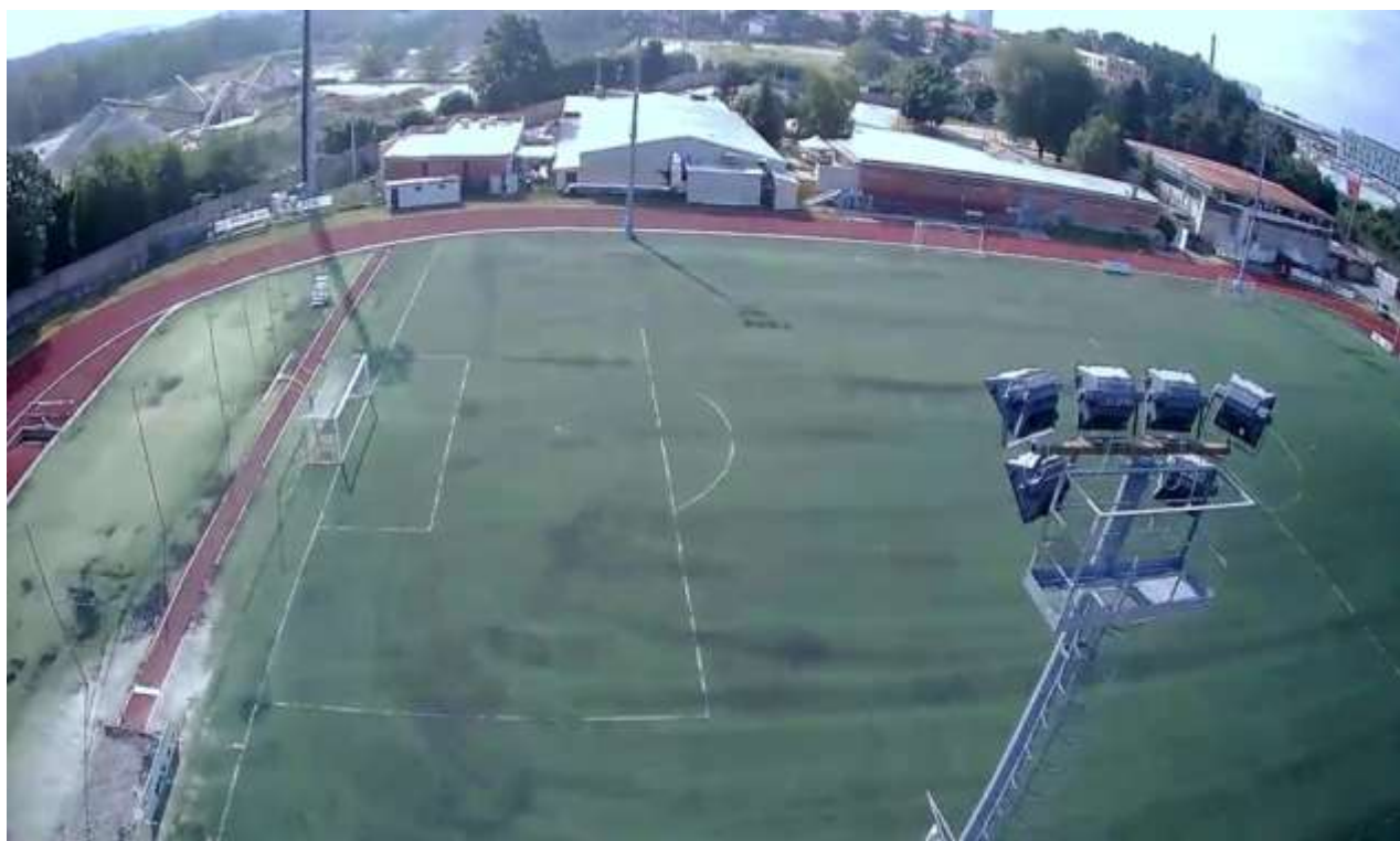
Punto di ripresa 4