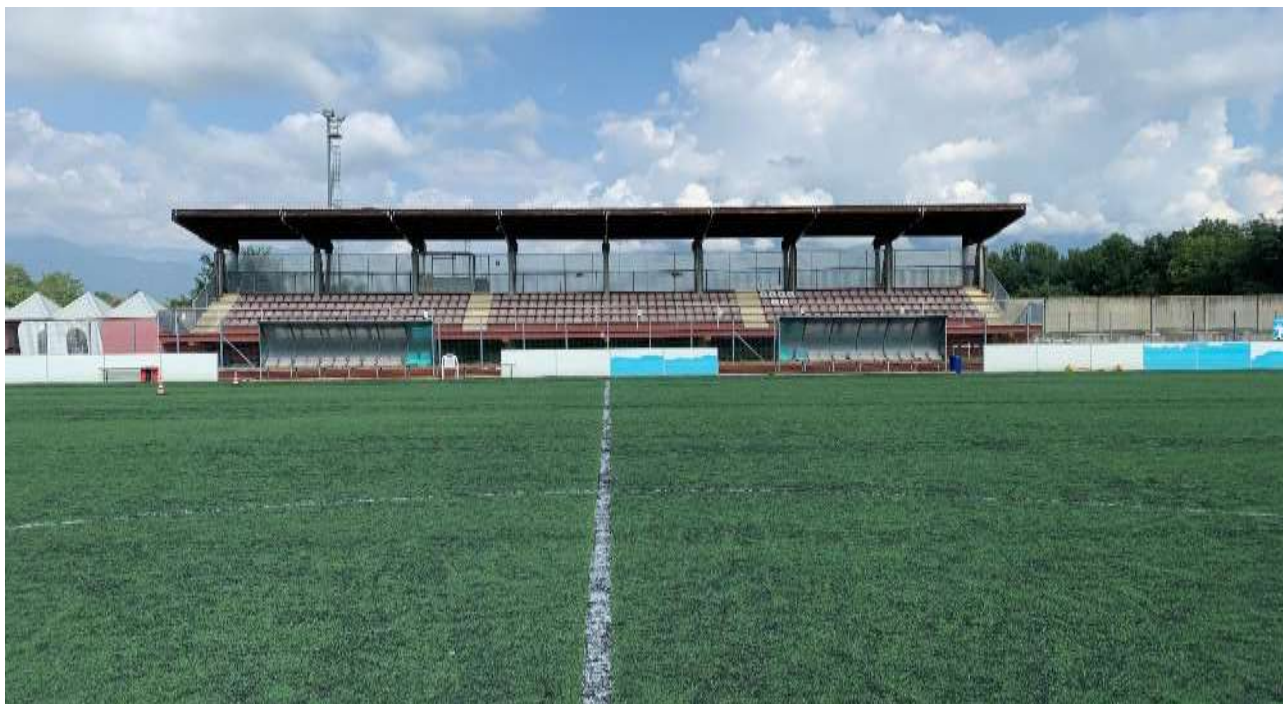
Punto di ripresa 11