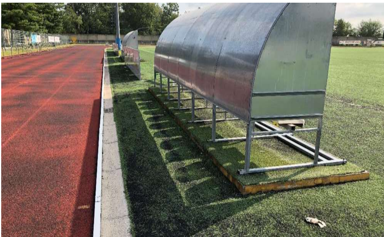
Punto di ripresa 12