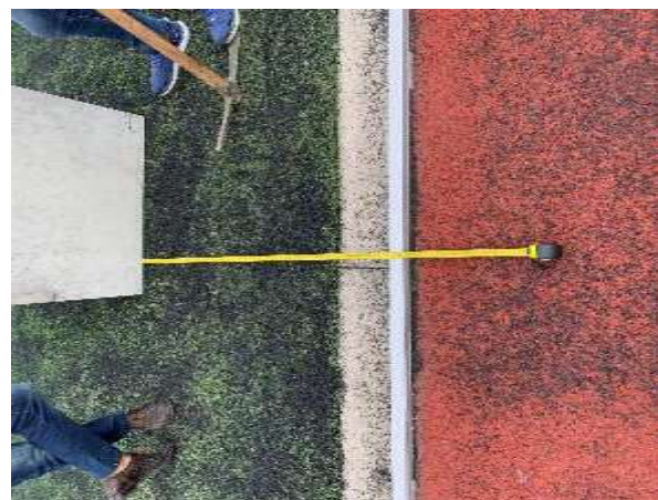
distanza da QE palo illuminazione