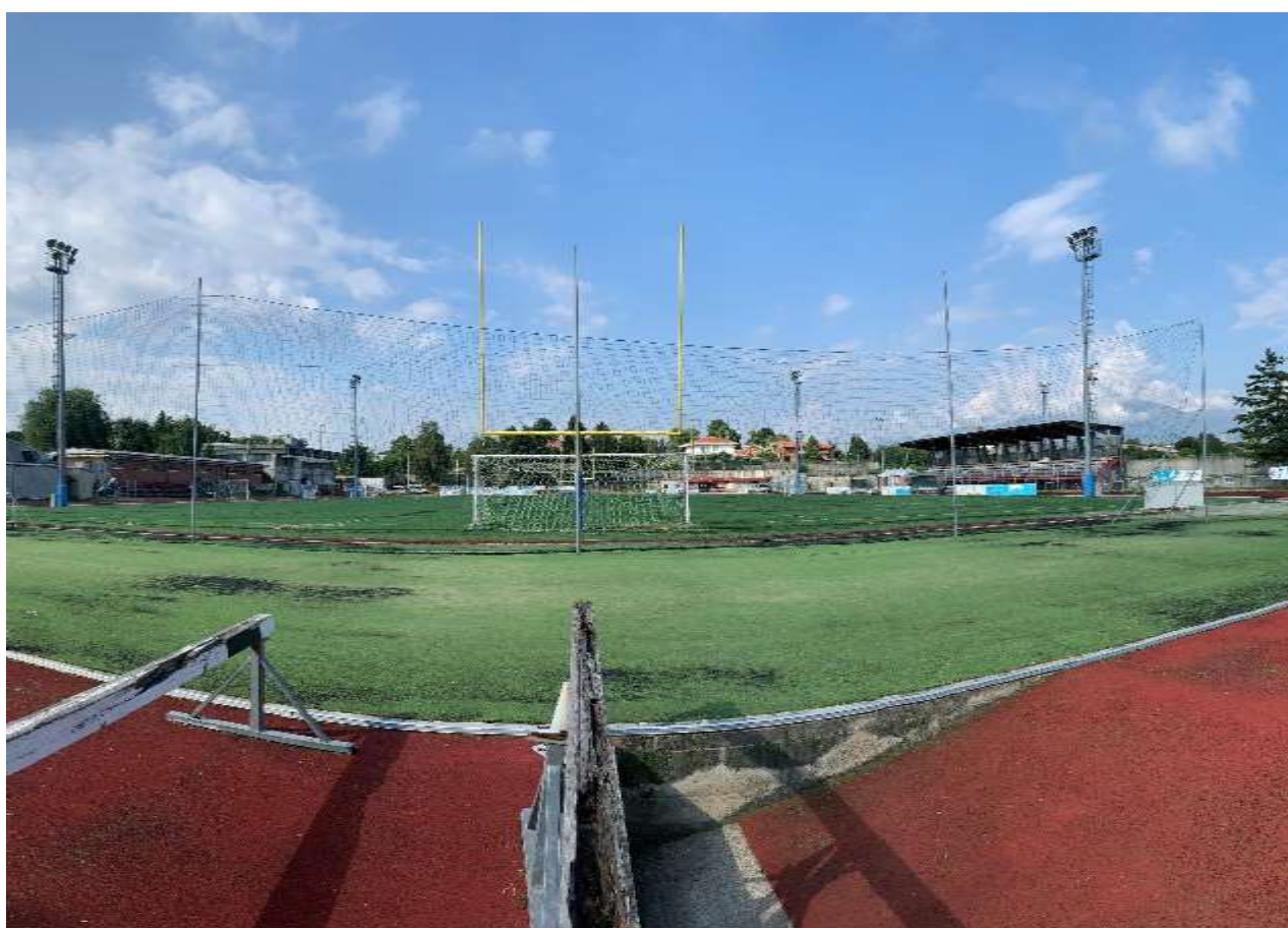
Punto di ripresa 10