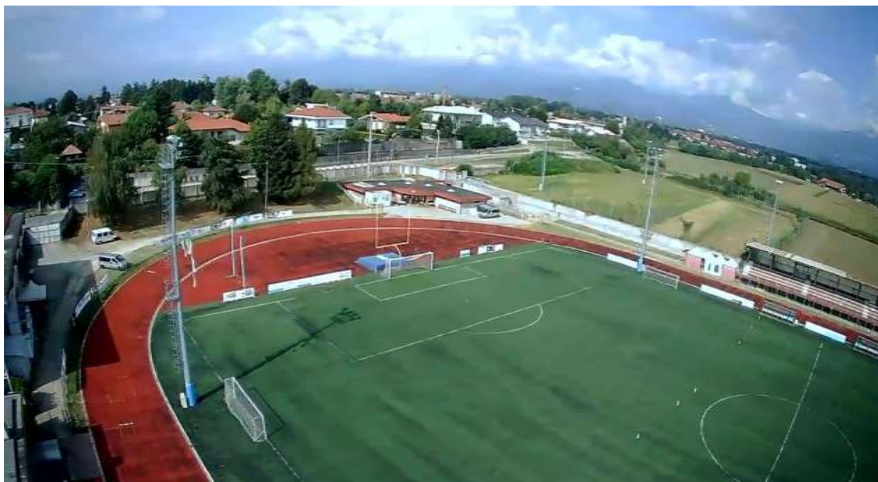
Punto di ripresa 1