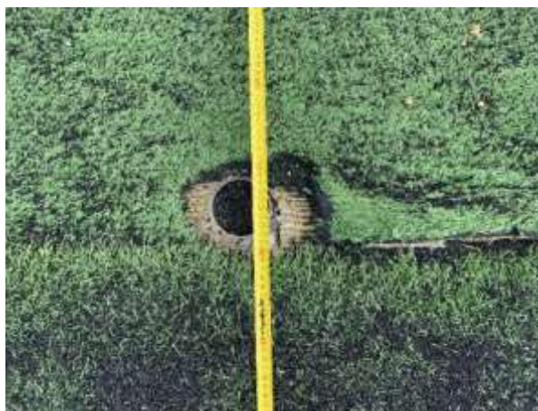
cordolo per rete parapalloni