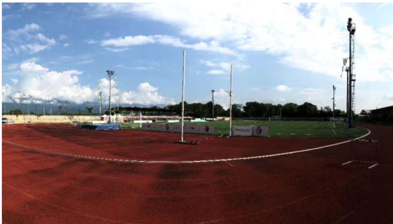
Punto di ripresa 7