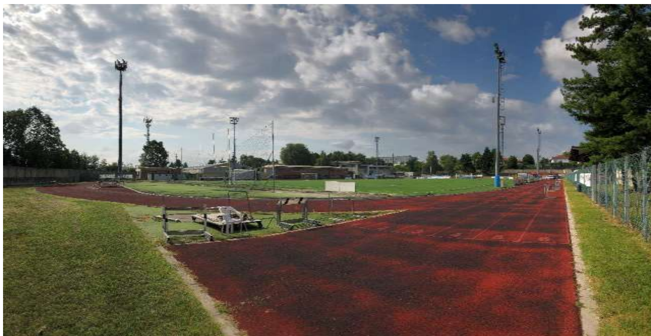
Punto di ripresa 8