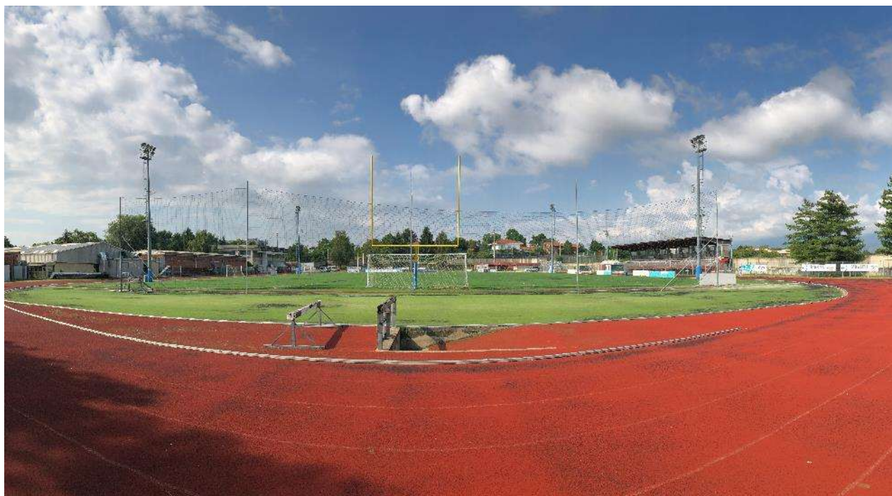
Punto di ripresa 9