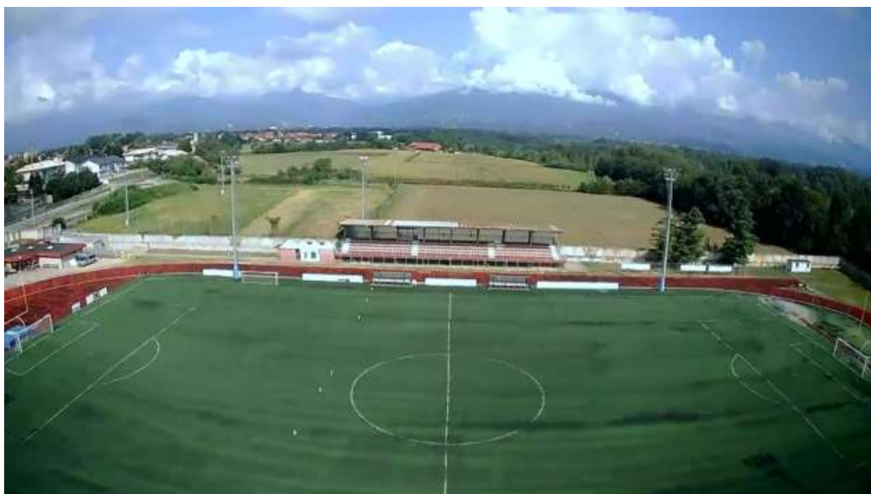
Punto di ripresa 2